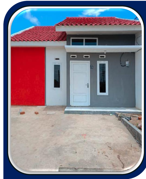
Pembangunan Perumahan Green Kemiling di Lampung