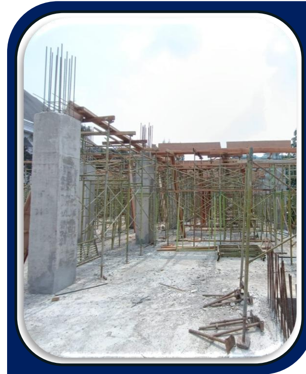
Pembangunan Gedung SMA HFO di Depok