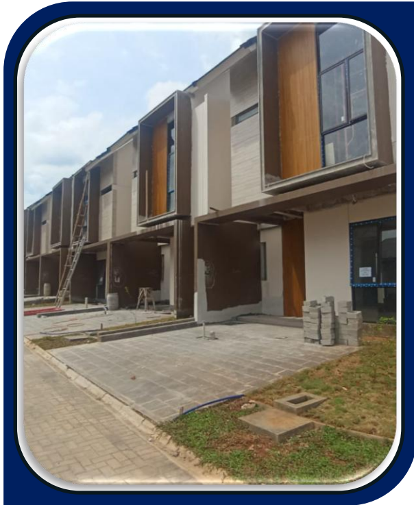
Pembangunan Perumahan Citra Garden di Serpong