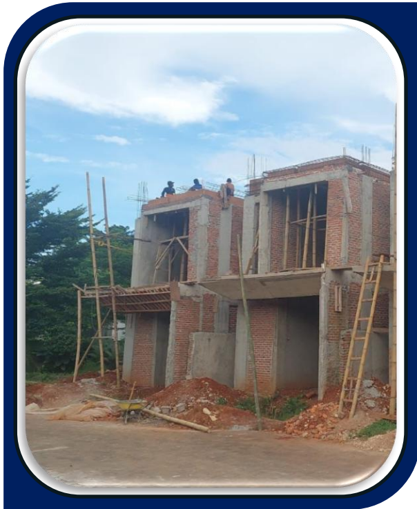
Pembangunan Perumahan Rumello Verde di Depok