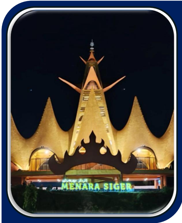
Pembangunan Menara Siger Tahap 3 di Bakauheni Harbour City